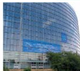
Zgrada Evropskog parlamenta u Briselu